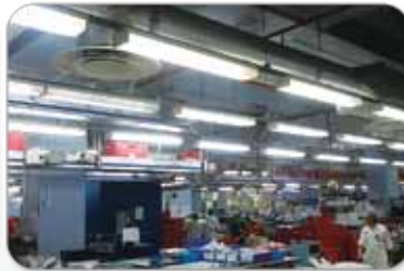
國泰航空飲食服務 (香港) 有限公司