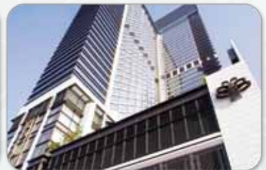
港島海逸君綽酒店