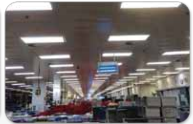
國泰航空飲食服務 (香港) 有限公司